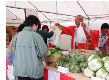
ドリームフェスティバル