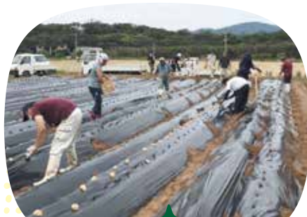
ジャガイモを定植しています