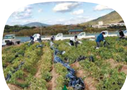
いよいよ収穫開始です