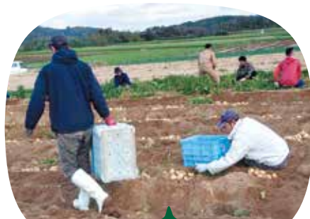
ジャガイモ収穫中です。 ちかっぱ糸島の商品になります